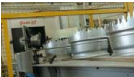
Sopra: metallo liquido trasferito nel forno elettrico; incremento della temperatura; nastro trasportatore.