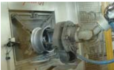
Sotto: finitura, impianto di verniciatura.