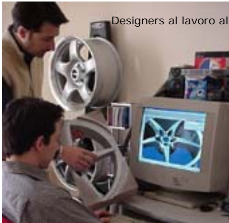
Designers al lavoro alla postazione CAS