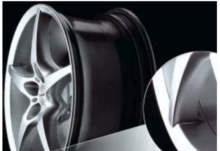
Sopra a destra: modello MAK Matrix, ottenuta per mezzo di uno stampo a carrelli mobili, pesa il 20% in meno delle ruote standard

Se le ruote devono essere ancora fuse al momento dell'ordine, i tempi di consegna si estendono ulteriormente, fino a 4 o 5 settimane.