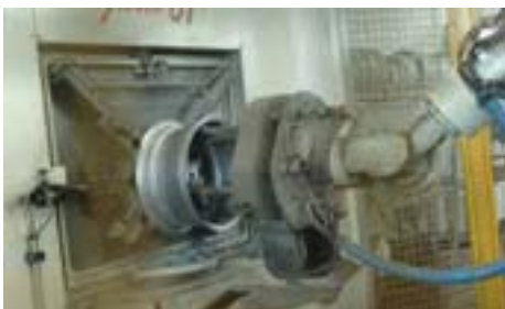
Sotto: finitura, impianto di verniciatura.